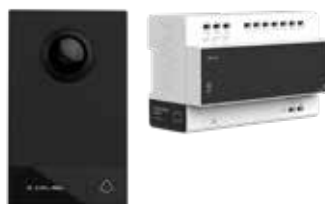
Kit vidéo, 2 fils, avec module de contrôle d'accès et poste extérieur vidéo réf. 510-01001