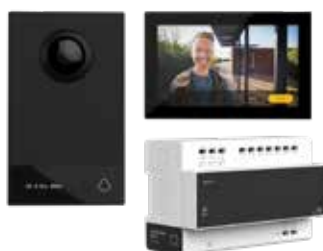
Kit vidéo, 2 fils, avec module de contrôle d'accès, poste intérieur vidéo et poste extérieur vidéo réf. 510-01501

Vous pouvez connecter jusqu'à cinq postes intérieurs au même module et même les utiliser en tant qu' interphone pour connecter différentes parties de votre habitation. Ou que diriez-vous d'un second poste extérieur pour votre porte arrière ou votre bureau à domicile ? Les possibilités sont infinies .