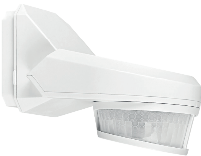
Portée de détection