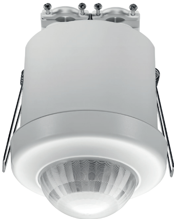
Portée de détection