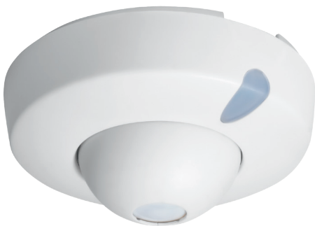
Portée de détection