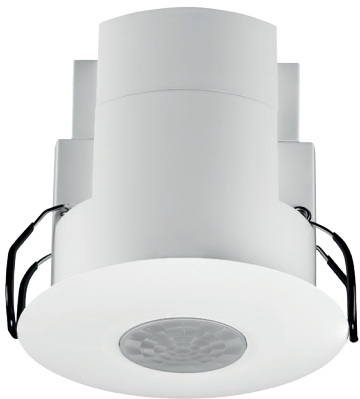
Portée de détection

Détecteur de présence, commande crépusculaire DALI, à encastrer dans des plafonds de 2,4 – 3 m. Autonome ou comme maître, en combinaison avec 10 détecteurs secondaires au maximum. Pour un usage dans des bureaux, des établissements scolaires, des salles de réunion... dans des locaux de toute taille. Le détecteur a au maximum 3 zones à commande crépusculaire, ainsi qu'un contact supplémentaire. Il se caractérise par un design ultraplat d'à peine 5 mm, permettant de le monter pratiquement de niveau avec le plafond. Selon l'application choisie, l'éclairage doit toujours être allumé manuellement à l'aide d'un bouton-poussoir et s'éteint automatiquement lorsque la lumière naturelle est suffisante ou lorsque plus personne n'est présent dans le local (détecteur d'absence). Ou l'éclairage s'allume automatiquement en cas de mouvement et si la lumière naturelle n'est pas suffisante. Il s'éteint aussi automatiquement lorsque la lumière naturelle est suffisante ou lorsque plus personne n'est présent dans la pièce (détecteur de présence). L'éclairage reste allumé tant qu'un mouvement est détecté et que le niveau de luminosité naturelle mesuré est inférieur à la valeur programmée. La temporisation de déconnexion, la valeur lux à laquelle l'éclairage doit s'allumer et la sensibilité du détecteur peuvent être facilement réglées à l'aide de la télécommande IR pour smartphone (en option). Couleur de finition: blanc. Détecteurs secondaires compatibles: 350-41659