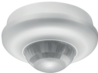
Portée de détection