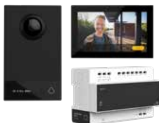
Kit vidéo, 2 fils, avec module de contrôle d'accès, poste intérieur vidéo et poste extérieur vidéo réf. 510-01501

Vous pouvez connecter jusqu'à cinq postes intérieurs au même module et même les utiliser en tant qu' interphone pour connecter différentes parties de votre habitation. Ou que diriez-vous d'un second poste extérieur pour votre porte arrière ou votre bureau à domicile ? Les possibilités sont infinies .