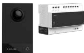
Kit vidéo, 2 fils, avec module de contrôle d'accès et poste extérieur vidéo réf. 510-01001